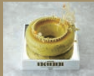
第1回BABBIグラン・プレミオ優勝作品 Ulysses(ユリシス) 阿部 由香(パティスリーアテスウェイ)

第1回大会では「BABBIピスタチオペースト デラックス」または「BABBIピスタチオペースト SC 無着色」を使用したアントルメで、2024年の第2回大会では「ヘーゼルナッツペースト ピエモンテIGP」の魅力を引き出したアントルメで優勝を競いました。今後、隔年での開催を予定しています。